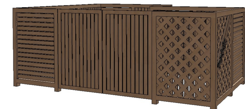
WIZUALIZACJA - WIDOK 2