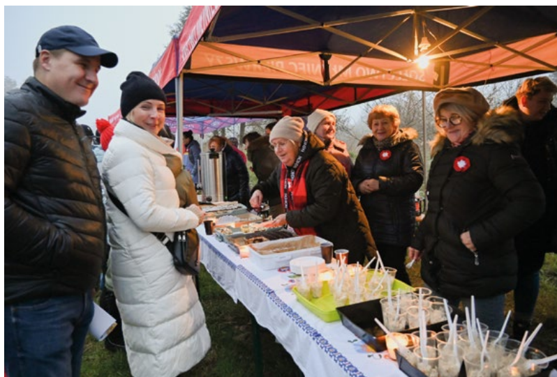
Stoiska KGW cieszyły się dużą popularnością