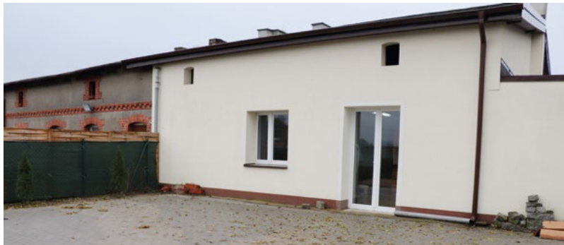
Przy świetlicy w Brzeźnie ekipa brukarska ZUK uporządkowała teren przyległy do budynku.

Zakład Usług Komunalnych w Lubiczu powstał po to, by systematycznie wykonywać zadania powierzone przez gminę, głównie w zakresie gospodarki wodno-ściekowej i obsługi serwisowej infrastruktury komunalnej gminy. Taki jest główny cel każdej takiej spółki działającej przy samorządach w całej Polsce, tak też jest obecnie w gminie Lubicz.