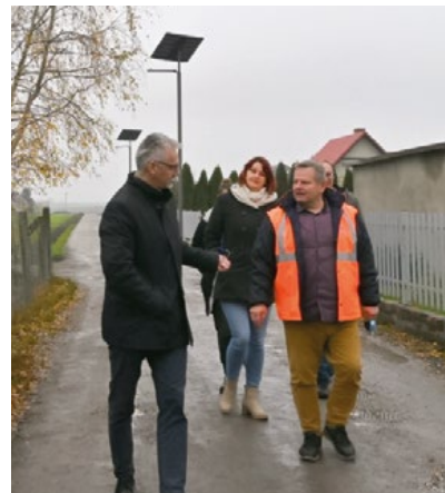
Odbiór lamp solarnych w Brzeźnie

Poza tym zbudujemy 33 lampy kablowe: w Grabowcu, Gronowie, Kopaninie, Lubicz Dolnym, Lubicz Górnym, Młyncu Pierwszym i Złotorii. Te lampy, z jednym wyjątkiem, będą miały wysokość 6 m. Wyjątek ten, to 3 lampy w parku w Lubicz Górnym – 5-metrowe. Oprawy wszystkich lamp będą typu LED.