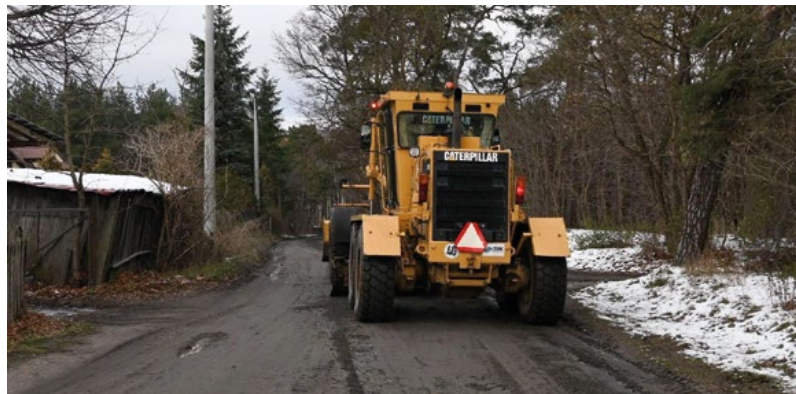
Równanie dróg gruntowych.