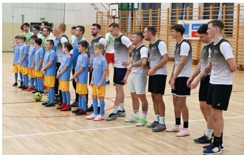
Tuż przed finałem. Na boisku KS Sokół Lubicz Dolny oraz Flisak Złotoria, wprowadzeni przez najmłodszych zawodników.