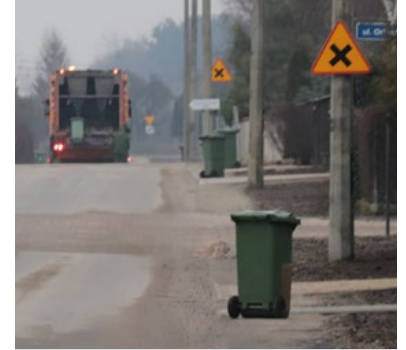
Kolejny rok śmieci z naszego terenu ma wywieźć spółka MPO