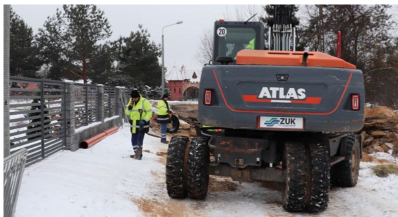
Budowa kanalizacji w ulicy Zdrojowej w Lubiczu Górnym.