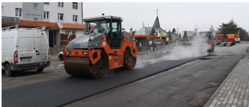
Ulica Piaskowa została wyasfaltowana.