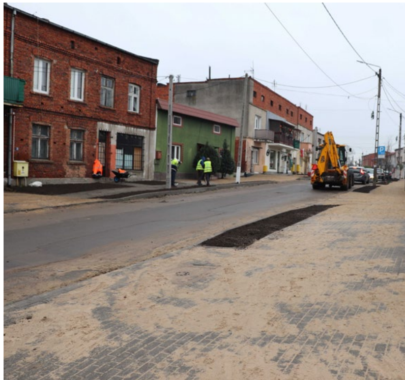
Ulica Lipnowska w trakcie remontu.