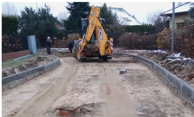
Ulica Kwiatowa – przygotowywanie podbudowy.