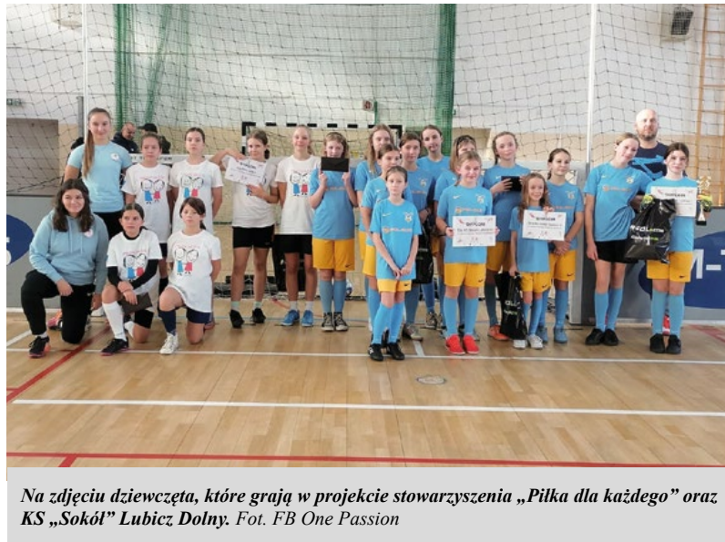
Na zdjęciu dziewczęta, które grają w projekcie stowarzyszenia „Piłka dla każdego” oraz KS „Sokół” Lubicz Dolny.

19 listopada, podczas „Let’s Play Lubicz”,