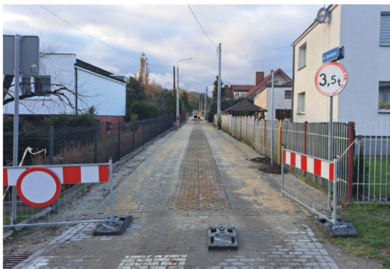
Ulica Spokojna jest już gotowa.

Sprawdzamy na jakim etapie są prace na gminnych inwestycjach drogowych w Lubiczu Dolnym.