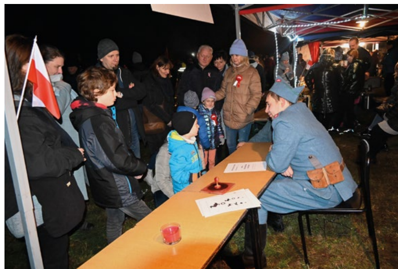
Punkt poboru do „Błękitnej Armii”