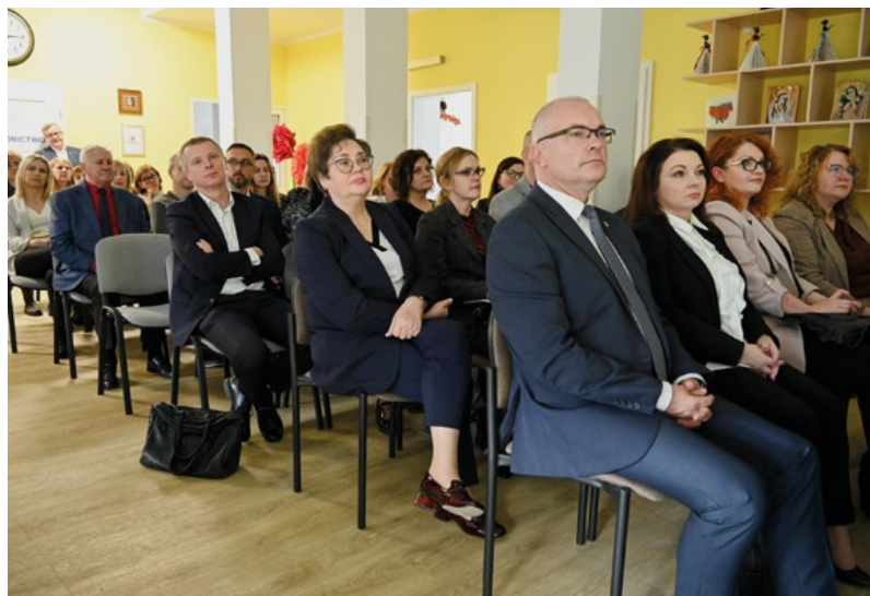
Konferencja odbyła się 7 listopada w Dziennym Domu „Senior+” w Gronowie