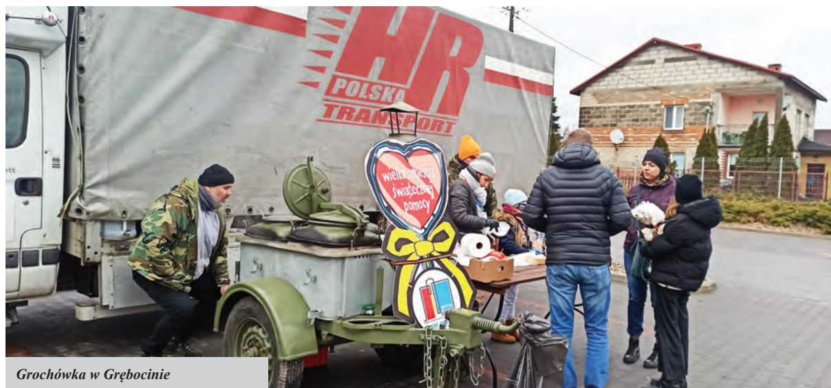
Grochówka w Grębocinie