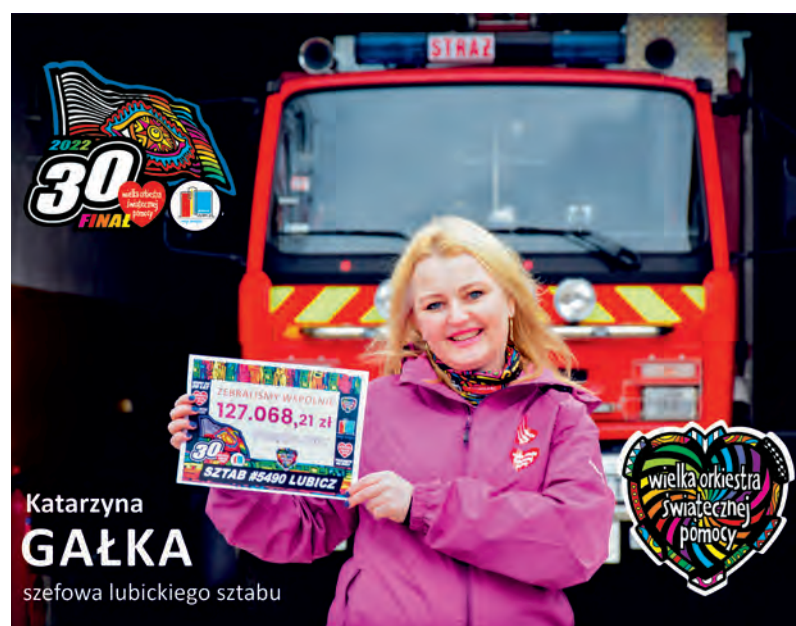
Fotorelacja z tegorocznego lubickiego finału Wielkiej Orkiestry Świątecznej Pomocy – str. 5.