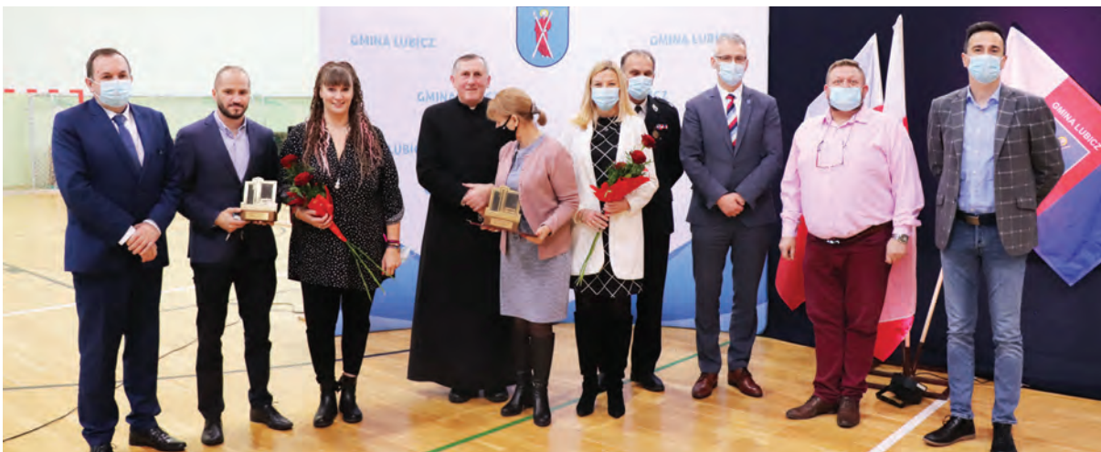
Nagrodzeni statuetką wójta za działalność w 2021 roku