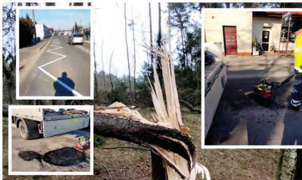
Na skutek wichur i aktualnej pogody konieczne są dziesiątki drobnych napraw