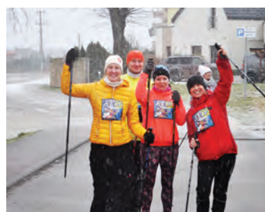
Pierwsi na mecie nordic walking