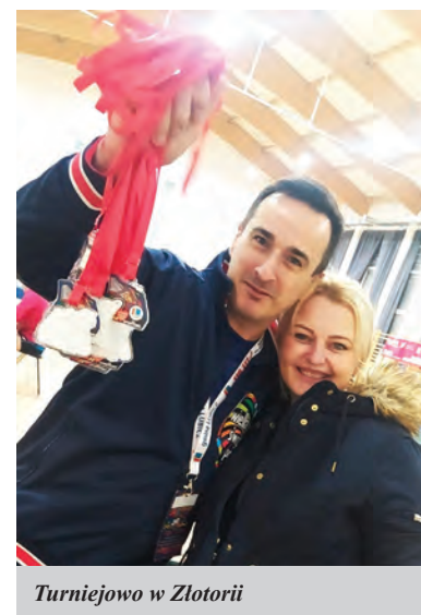
Turniejowo w Złotorii