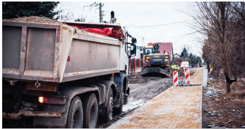
Prace są wykonywane wszędzie tam, gdzie nie kolidują z infrastrukturą podziemną.

Budowa ul. Toruńskiej w Grębocinie niemal od początku była związana z trudnościami. Konieczność wykonania bardzo głębokich wykopów, aby ułożyć kanalizację deszczową z zachowaniem odpowiednich spadów, niespodzianki w postaci nigdzie nieodnotowanych sieci podziemnych, kolizja z siecią gazową i konieczność jej przebudowy przez DUON oraz kolizje energetyczne, których przebudowa wymaga zatwierdzenia przez Energe. Dodatkowo w marcu ubiegłego roku, z powodu braków kadrowych wywołanych pandemią, wykonawca, czyli Transbruk, ograniczył zakres wykonywanych prac, natomiast w lipcu 2021 zszedł z placu