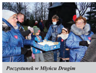
Poczęstunek w Młyńcu Drugim