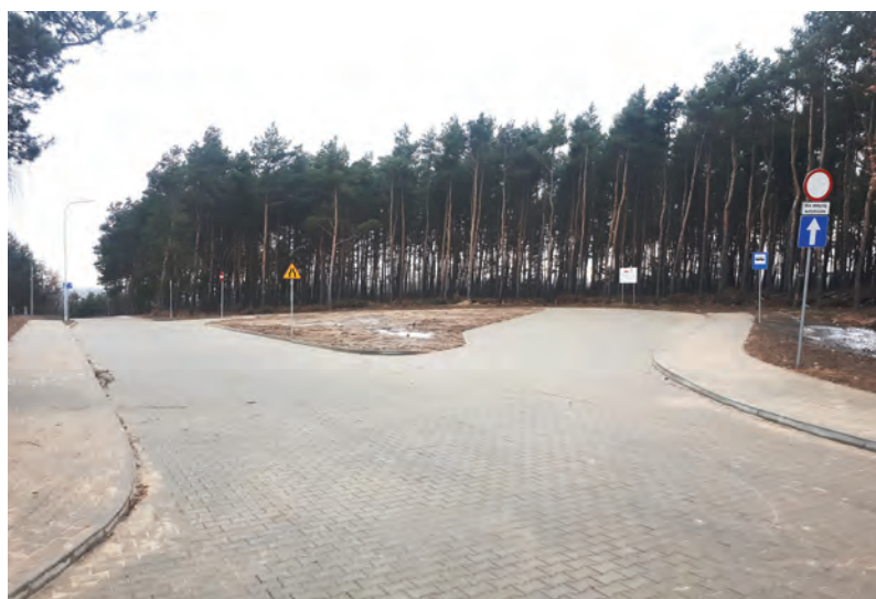
Nowa pętla autobusowa przy ul. Piaskowej w Lubiczu Górnym koło lasu