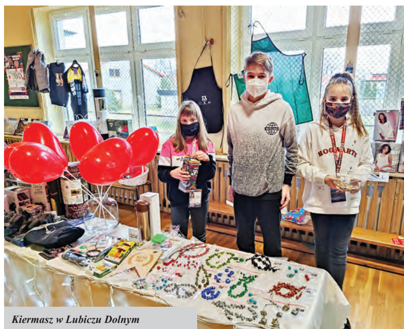
Kiermasz w Lubiczu Dolnym