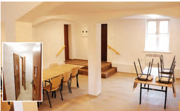
W pełni wyremontowana świetlica w Grabowcu