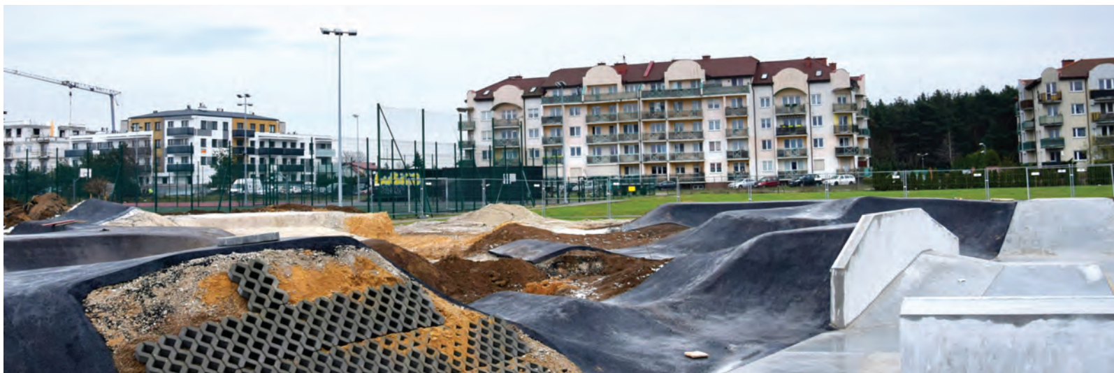
W centrum Lubicza Górnego ma powstać pumtrack dla młodzieży i plac zabaw dla młodszych dzieci

Zakończyliśmy pierwszy etap modernizacji placu zabaw przy ul. Tulipanowej w Lubiczu Dolnym. Zdemontowano zniszczone urządzenia (ciuchnię i huśtawkę) i zamontowano nowe: zestaw zabawowy oraz huśtawkę równoważną i huśtawkę „bocianie gniazdo”. Wykopano też uschnięte tuje, nasadzając nowe. Jeszcze w tym roku Spółdzielnia Socjalna „Lubiczanka” naprawi zniszczone czasem elementy infrastruktury drewnianej i zamontuje furtkę. Pojawią się także ławka i kosze, w tym jeden z przeznaczeniem na psie odchody. Drugi etap modernizacji będzie na wiosnę przyszłego roku. Zostaną odmalowane te elementy infrastruktury, które tego wymagają i naprawione daszki nad domkami. Poza tym na plac zabaw przyjadą trzy duże wywrotki świeżego piasku – zarówno na wymianę do piaskownicy, jak również do rozsypania pod urządzeniami. Niedawno informowaliśmy też, że plac zabaw zyskał dodatkowe oświetlenie. Remont placu zabaw został sfinansowany z funduszu sołectkiego wydzielonego z budżetu gminy oraz z budżetu gminy.