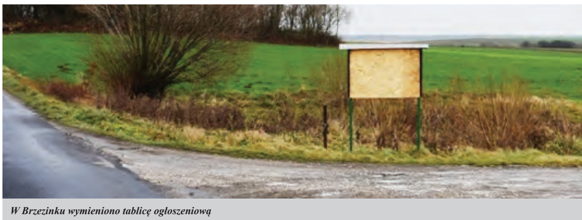
W Brzezinku wymieniono tablicę ogłoszeniową