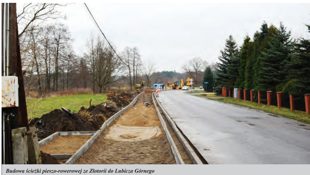
Budowa ścieżki pieszo-rowerowej ze Złotorii do Lubicza Górnego

siano trawę. – To będzie plac użytkowy służący naszym mieszkańcom na różnego rodzaju spotkania – mówi sołtys Piotr Dąbrowski.