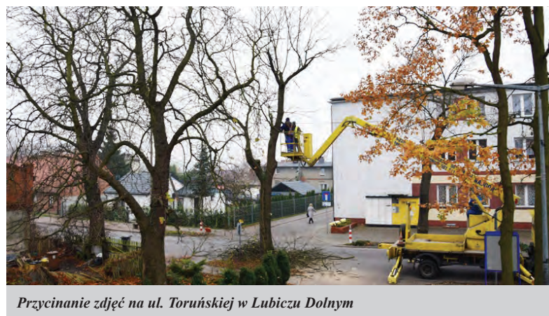
Przycinanie zdjęć na ul. Toruńskiej w Lubiczu Dolnym