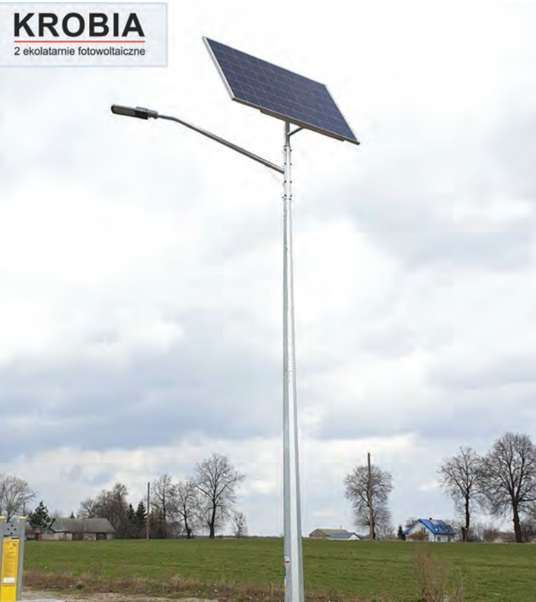
W Krobi staną takie ekolatarnie. Zostały zamówione, czekamy na dostawę

Jeszcze w tym roku w Krobi na ul. Wiejskiej zostaną położone dwa (po-