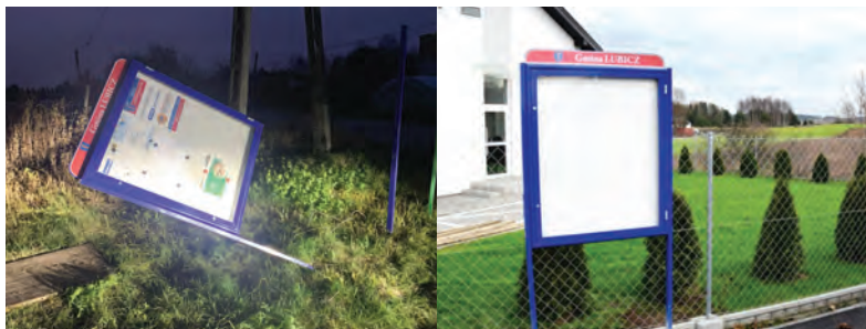
Tak wandal potraktował tablicę w Nowej Wsi, obok nowa gabłota w Młyńcu Drugim