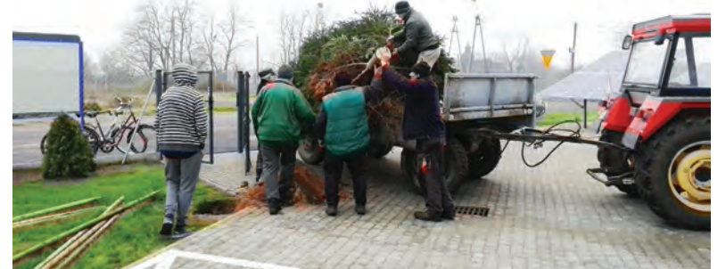
O udekorowanie choinką okolic nowej świetlicy w Młyńcu Drugim zadbali sołtys i rada sołecka.