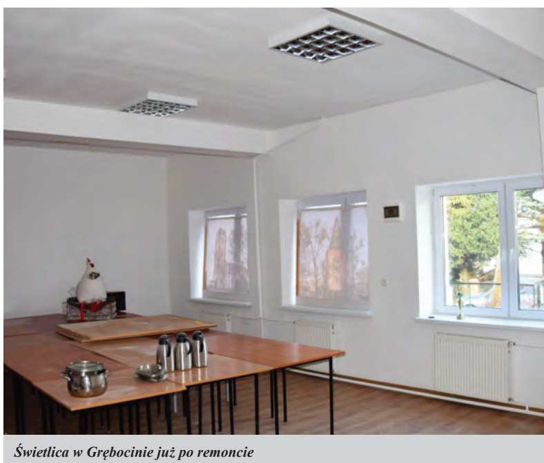
Świetlica w Grębobocinie już po remoncie