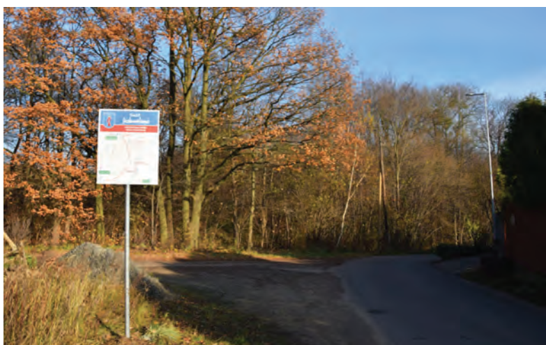
Trakt Jedwabno to doskonałe miejsce do aktywności fizycznej na świeżym powietrzu

dwójne) progi zwalniające. Poza tym pilotażowo, właśnie w tej miejscowości, na ul. Owocowej gmina chce ustawić dwie ekolatarnie. W tegorocznym budżecie sołectkim zostały niewykorzystane pieniądze i sołtys wraz z radą sołectką zdecydowali, że warto zacząć uzupełnianie nieoświetlonych miejsc. Ponieważ normalna procedura jest kosztowna i przede wszystkim długotrwała, więc urząd zasugerował pójście w stronę latarni fotowoltaicznych. W takim przypadku latarnia może stać się szybciej, a dodatkowo prąd będzie za darmo – ze światła zewnętrznego. W Lubiczu Dolnym wzdłuż ul. Toruńskiej zostały przycięte uschnięte drzewa, a te schorowane i nienadające się do dalszej pielęgnacji wycięte. Ze względów bezpieczeństwa usunięto również stare topole rosnące na skraju boiska na terenie szkoły w Grębocinie.