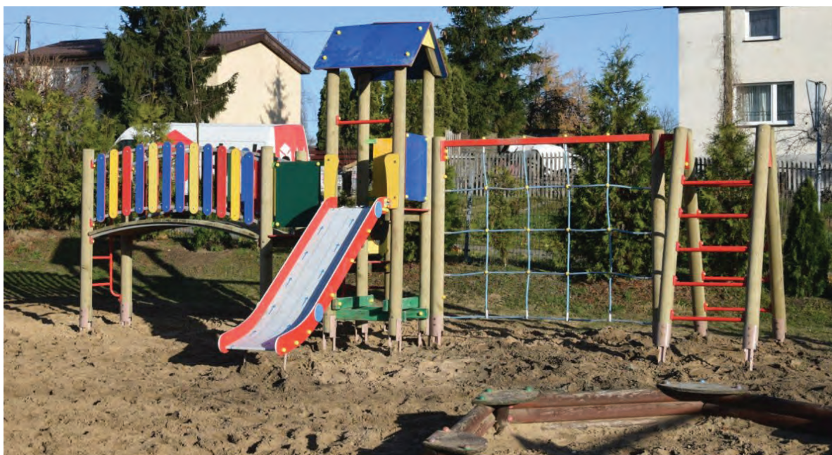
Plac zabaw w Lubiczu Dolnym wzbogacił się o nowe urządzenia

dwójne) progi zwalniające. Poza tym pilotażowo, właśnie w tej miejscowości, na ul. Owocowej gmina chce ustawić dwie ekolatarnie. W tegorocznym budżecie sołectkim zostały niewykorzystane pieniądze i sołtys wraz z radą sołectką zdecydowali, że warto zacząć uzupełnianie nieoświetlonych miejsc. Ponieważ normalna procedura jest kosztowna i przede wszystkim długotrwała, więc urząd zasugerował pójście w stronę latarni fotowoltaicznych. W takim przypadku latarnia może stać się szybciej, a dodatkowo prąd będzie za darmo – ze światła zewnętrznego. W Lubiczu Dolnym wzdłuż ul. Toruńskiej zostały przycięte uschnięte drzewa, a te schorowane i nienadające się do dalszej pielęgnacji wycięte. Ze względów bezpieczeństwa usunięto również stare topole rosnące na skraju boiska na terenie szkoły w Grębocinie.