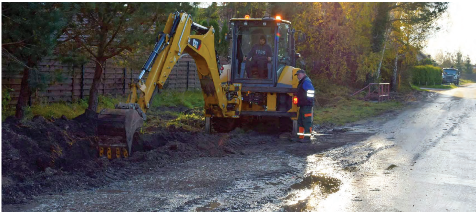
Na ul. Wiatracznej w Grębobocinie poprawiono meliorację