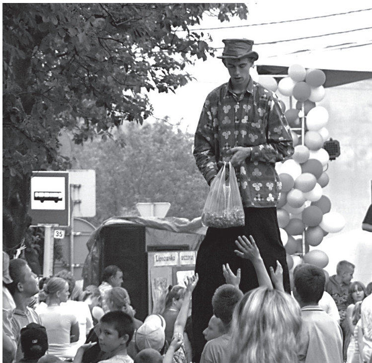
Szczudlarz na ulicy Lipnowskiej z góry rozdawał prezenty dla najmłodszych

Na zakończenie imprezy organizatorzy zaplanowali pokaz sztucznych ogni, który obserwować można było z odległości wielu kilometrów.