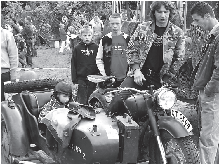
W Lubiczu Dolnym nigdy nie brakuje chętnych, aby sprawić dzieciom radość

Przez cały czas panie z Caritasu obdarowywały dzieci słodyczkami i maskotkami. Wszystkim dopisywały dobre humory, nie zawiodła również pogoda. Następnym dniem dziecka już za rok! Wtedy również zapewnimy naszym pociechom uśmiechy na twarzach.