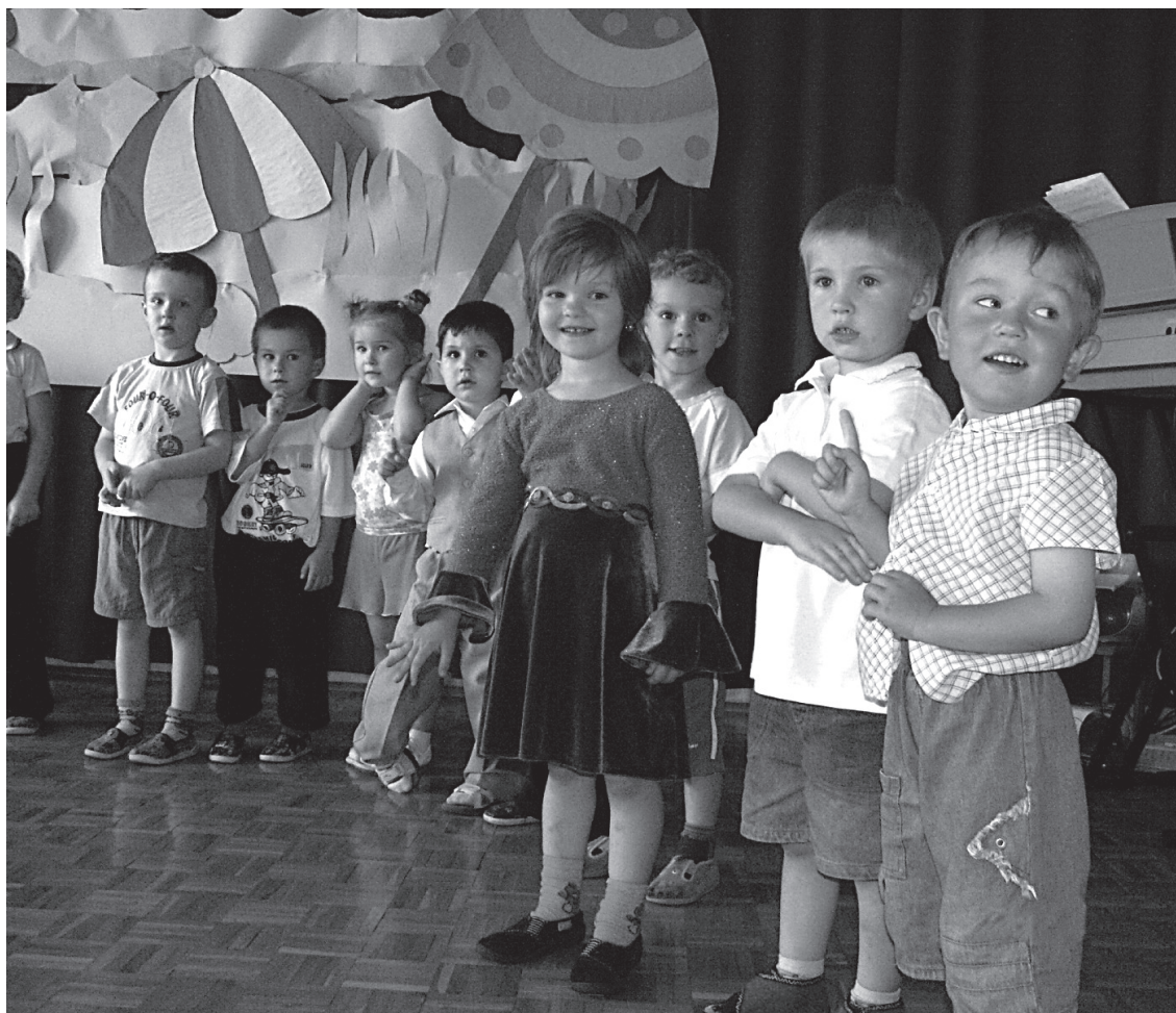
Rok szkolny zakończyli już nie tylko uczniowie, ale także przedszkolaki z gminnego przedszkola w Lubiczu Górnym. Zaczęły się tak upragnione wakacje.