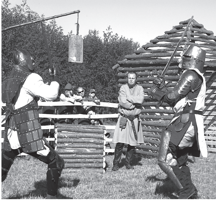
W dniach 3 i 4 czerwca 2006r. na terenie Muzeum Piśmiennictwa i Drukarstwa w Grębocinie odbyły się Potyczki rycerskie oraz Święto Papieru i Drukarstwa.

Takie przedsięwzięcie na terenie Muzeum było organizowane po raz pierwszy i wszyscy liczymy, że wpisze się w kalendarz imprez już na stałe.