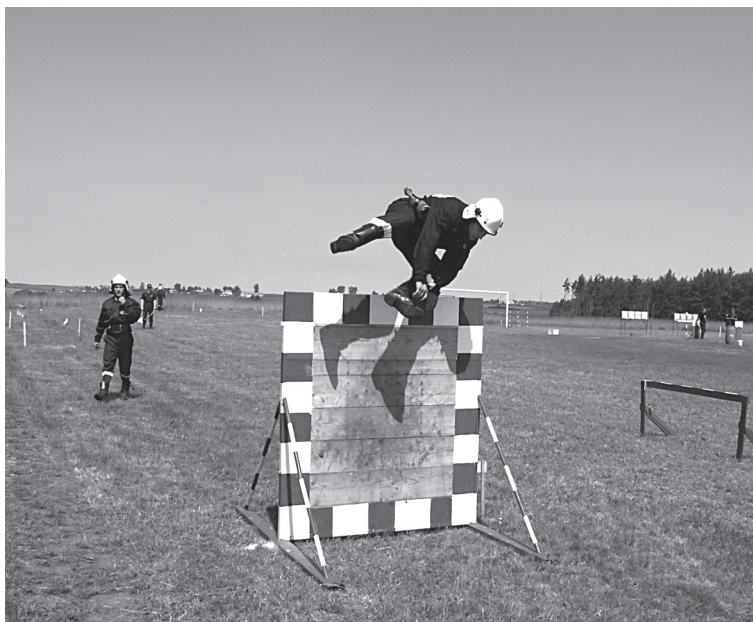
Strażacy z gminnych OSP od lat prezentują bardzo wysokie poziom sprawności

11 czerwca 2006 r. w Młynku Pierwszym odbyły się Gminne Zawody Sportowo – Pożarnicze jednostek Ochotniczych Straży Pożarnych. Organizatorem zawodów był Zarząd Oddziału Gminnego Związku OSP RP i Komenda Miejska PSP w Toruniu przy współudziale Urzędu Gminy Lubicz. Zawody rozegrane zostały w dwóch konkurencjach, sztafety pożarniczej i ćwiczenia bojowego.