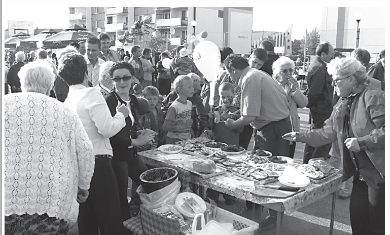
Festyny rodzinne pod patronatem medialnym Radia Gra i Gazety Pomorskiej, a organizowane przez Gminę Lubicz i Spółdzielnię Mieszkaniową w Lubiczu stają się powoli tradycją.

Wzór wniosku dostępny jest w Urzędzie Gminy w Lubiczu p. 37, na stronie internetowej www.lubicz.pl lub stronie Ministerstwa Rolnictwa i Rozwoju Wsi.