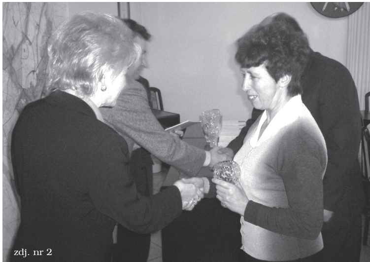
zdj. nr 2