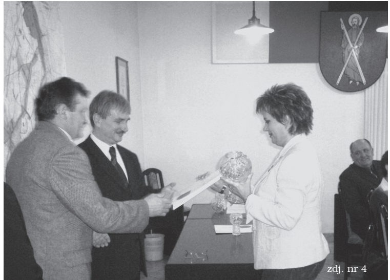
zdj. nr 4