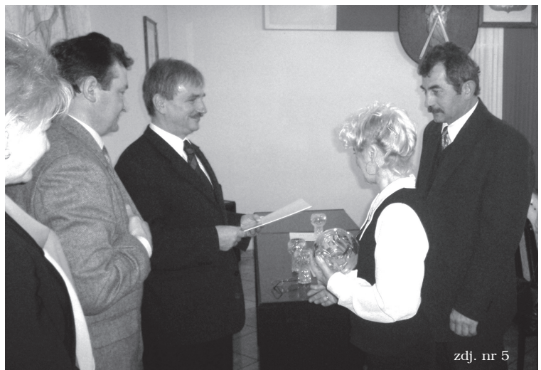
zdj. nr 5