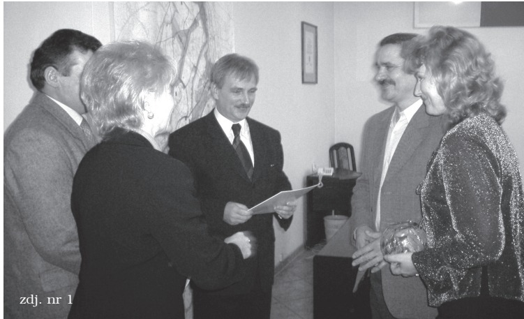
zdj. nr 1

Uroczyste podsumowanie konkursu odbyło się w dniu 8 listopada 2004 r. w Urzędzie Gminy w Lubiczu.