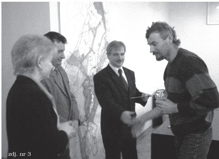
zdj. nr 3