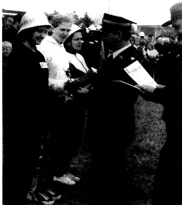
Czas na dyplomy