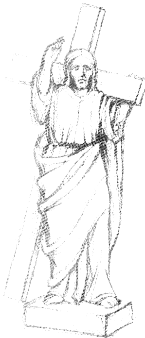
Przydrożne krzyże, figury, kapliczki, są jak drogowskazy na drogach naszego życia...