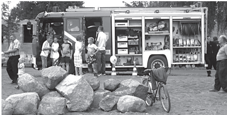
Po raz trzeci mieszkańcy Kopanina bawili się na festynie.