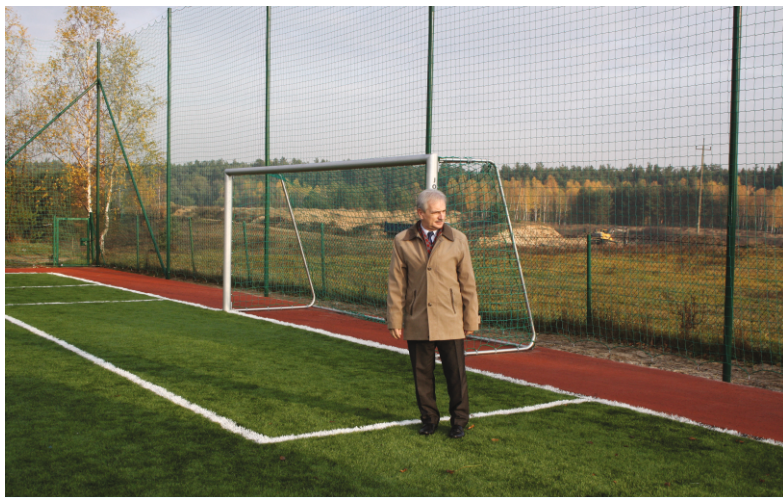
Wójt Gminy Lubicz na nowo otwartym boisku

W samo południe 8 listopada w Młyńcu Pierwszym rozpoczęła się uroczystość otwarcia zespołu boisk, wybudowanych tuż przy Szkole Podstawowej.