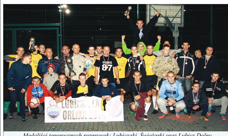
Medaliści tegorocznych rozgrywek: Lubiczaki, Świeżaki oraz Lubicz Dolny

Tegoroczne zmagania rozpoczęły się 7 kwietnia – rozegrano łącznie 63 mecze, w trakcie których strzelono 564 gole, co daje średnią na mecz prawie 9 bramek i w porównaniu z zeszłoroczną edycją ligi jest wynikiem nieco gorszym (571 bramek).