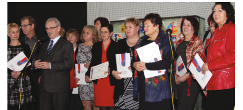
Wręczenie symbolicznych czeków przedstawicielom Stowarzyszeń

Mamy nadzieję, iż wszyscy uczestnicy III Biesiady Jesiennej połączonej z Gminnym Dniem Seniora bawili się wspaniale, nie zapominając ani na chwilę, iż celem spotkania było szczere i głębokie podziękowanie im za rok ciężkiej pracy i aktywnej działalności na rzecz wszystkich mieszkańców gminy Lubicz.