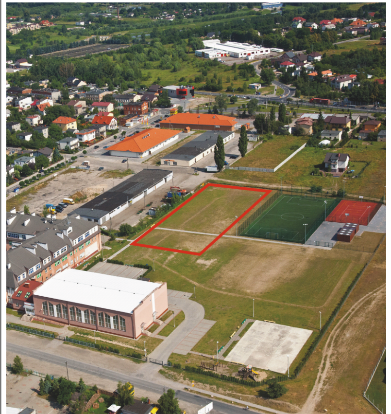
Schematyczna lokalizacja krytej pływalni w Lubiczu Górnym

Przypomnijmy, że pływalnia powstanie na działce przy Zespole Szkół w Lubiczu Górnym, z wejściem od ulicy Handlowej.