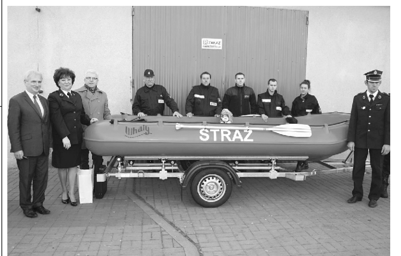
Łódź z przyczepą dla Ochotniczej Straży Pożarnej w Złotorii

Strażakom ze Złotorii, miejscowości położonej między ujściem Drwęcy do Wisły, z pewnością przyda się łódź ratunkowa, mamy jednak nadzieję, że przede wszystkim, do ćwiczeń.