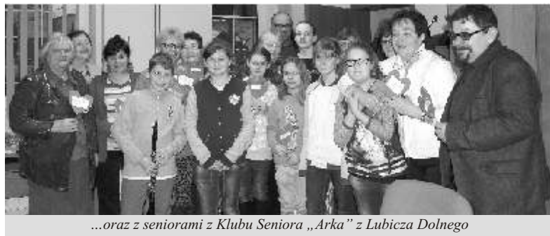
...oraz z seniorami z Klubu Seniora „Arka” z Lubicza Dolnego