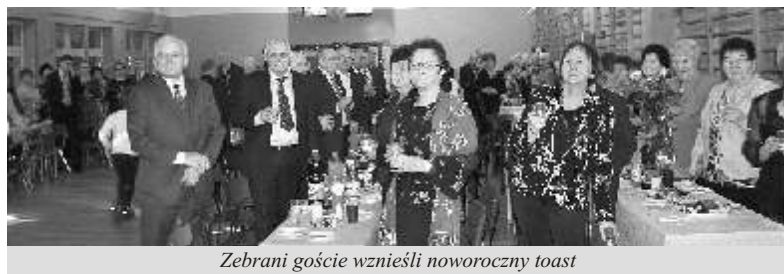
Zebrani goście wzniesli noworoczny toast

Muzykę do zabawy zapewnił zespół „Klip”. Impreza jak co roku cieszyła się dużym zainteresowaniem, a zabawa trwała do późnych godzin wieczornych.