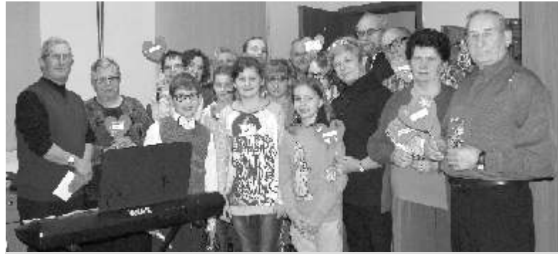
Uczniowie wraz z seniorami ze Stowarzyszenia Kulturalnego „Pokolenia”....

Jako podziękowanie członkowie SK PCK otrzymali od babć i dziadków czekoladki. Spotkania upłynęły w miłej i serdecznej atmosferze, czego dowodem były uśmiechy na twarzach seniorów i dzieci.