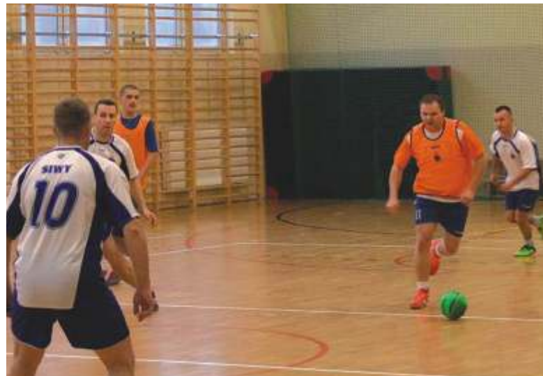
W sezonie zimowym piłka halowa cieszy się dużym zainteresowaniem

Za nami pierwsze mecze Otwartej Ligi Lubicza w Halowej Piłce Nożnej.