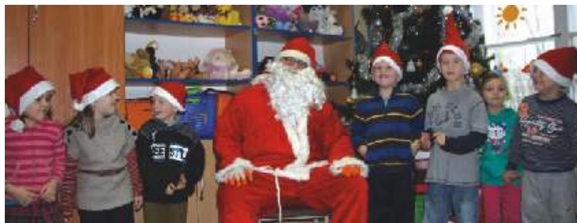
Mikołaj wśród lubickich dzieci

Tegoroczne mikołajki stanęły pod znakiem ataku prawdziwie zimowej aury.