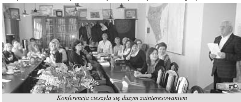
Konferencja cieszyła się dużym zainteresowaniem

Uczestnicy konferencji wyrazili swoje zadowolenie z organizacji pierwszego spotkania związanego ze zdrowiem psychicznym, uznali je za bardzo potrzebne i liczą na kontynuację tematu w przyszłości.