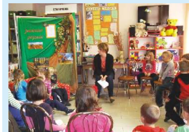
Biblioteka organizuje spotkania dla najmłodszych

W kategorii młodziczek pierwsze miejsce zajął zespół MTS Kwi-