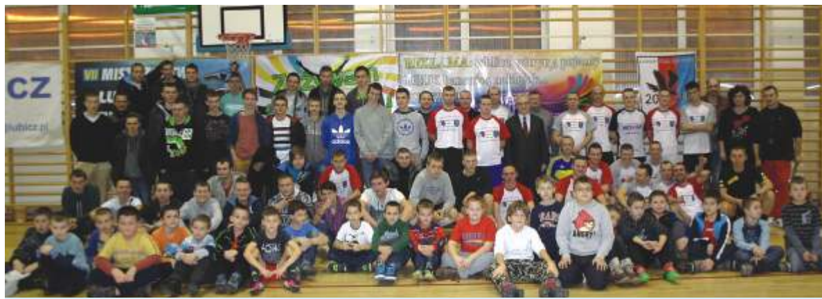
Uczestnicy i gospodarze VII Mistrzostw w futsalu

W dniach 17 i 30 listopada i 7 grudnia br. w hali sportowej Zespołu Szkół Nr 1 w Lubiczu Górnym rozegrano „VII Mistrzostwa Lubicza w Futsalu”.