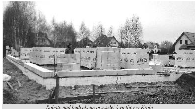
Roboty nad budynkiem przyszłej świetlicy w Krobi

Wielkim wyzwaniem dla gminy będzie rozpoczęcie budowy krytej pływalni w Lubiczu Górnym. Na dzień dzisiejszy trwają procedury wyłonienia partnera budowy.