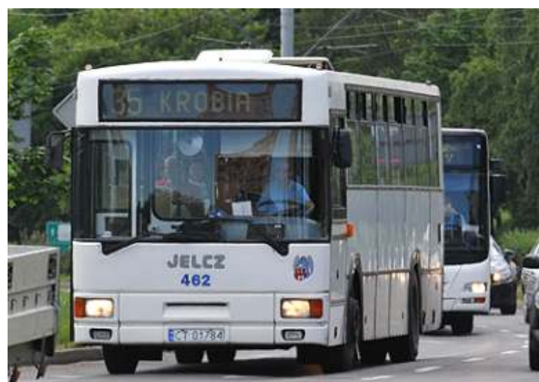
W 2014 roku gmina Lubicz będzie nadal współpracować z MZK Toruń

Szczegółowy wykaz ulg, wraz z informacją dotyczącą zakupu biletów specjalnych znajduje się w dodatkowej wkładce zawartej w tym numerze „Gońca” poświęconej komunikacji zbiorowej w gminie Lubicz.