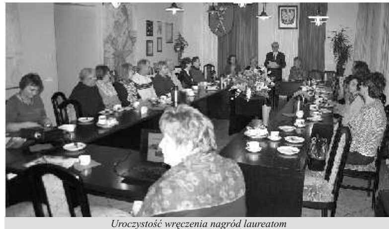
Uroczystość wręczenia nagród laureatom