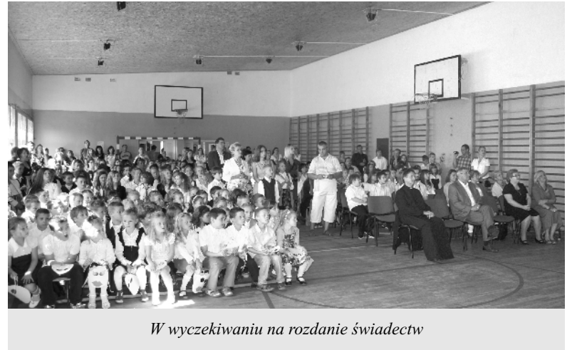
W wyczekiwaniu na rozdanie świadectw