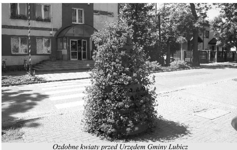
Ozdobne kwiaty przed Urzędem Gminy Lubicz