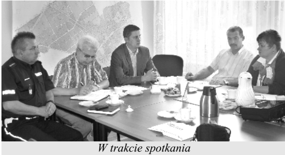
W trakcie spotkania

Będziemy na bieżąco informować o konkretnych decyzjach w tym zakresie.