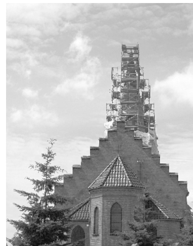
Wieża kościoła w trakcie prac remontowych

Przeszło stuletnia świątynia, służąca do sprawowania kultu Bożego dla ponad trzech tysięcy parafian – mieszkańców wsi Złotoria, Nowa Wieś i Kopanino, wymaga jednak szczególnej troski. Ponieważ doraźne naprawy okazały się nie-