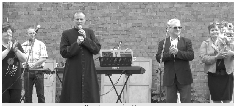
Powitanie gości Festynu