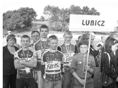
Reprezentacja gminy Lubicz