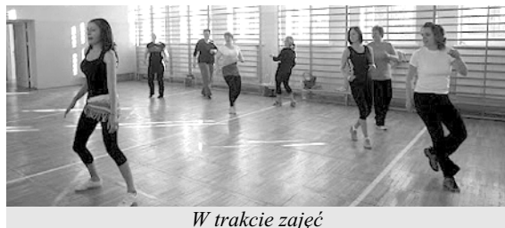
W trakcie zajęć

Zumba to przede wszystkim świetna zabawa. Kombinacja ta zaprojektowana dla wszystkich, bez ograniczeń wiekowych, kondycyj-