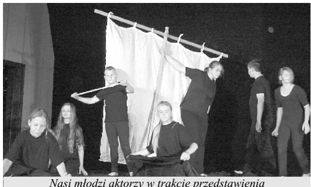
Nasi młodzi aktorzy w trakcie przedstawienia

Spektaklom konkursowym towarzyszyły przedstawienia teatrów profesjonalnych. Ze wzruszającym spektaklem „Szczęśliwy książę” przyjechał Teatr Lalki i Aktora z Łomży, sztukę „Mignone” odwłującą się do cyrkowej błazenady, groteski i barokowej maski wystawił w miejskim parku teatr „Wędrujące Lalki Pana Pejo” z Sankt Petersburga. W konwencji pantomimy obejrzelśmy w plenerze „Obrazki nieznanego malarza” Teatru Nikoli z Krakowa Mikołaja Wiepiewa, za przepiękną plenerowy spektakl o party na legendach o syrenach „Syrenada”