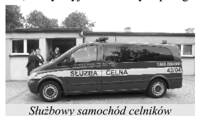
Służbowy samochód celników