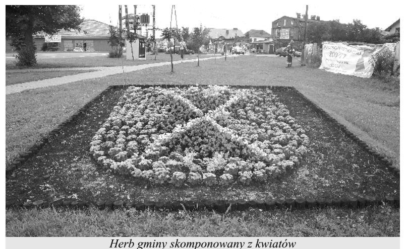
Herb gminy skomponowany z kwiatów