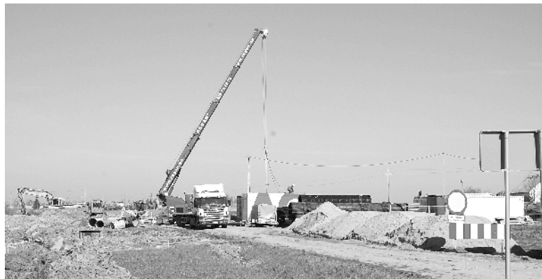
Budowa drogi w Brzeźnie

Obecnie wykonywane są roboty ziemne na dużą skalę. Aby zapobiec zniszczeniu dróg gminnych, Zarząd Dróg, Gospodarki Mieszkaniowej i Komunalnej w Lubiczu zawarł