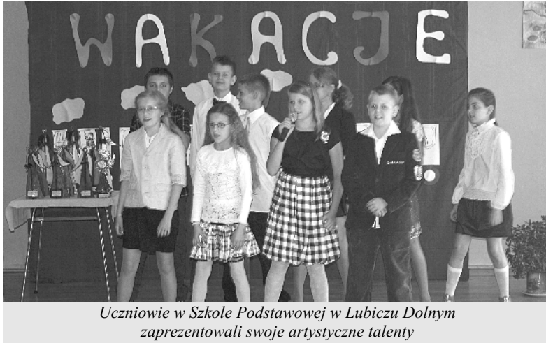
Uczniowie w Szkole Podstawowej w Lubiczu Dolnym zaprezentowali swoje artystyczne talenty

Służba Celna odwiedziła szkołę w Gronowie - relacja na stronie 4