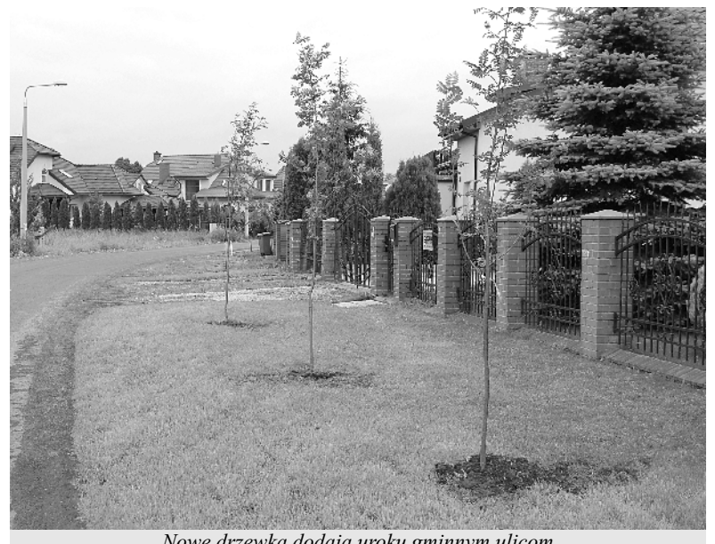
Nowe drzewka dodają uroku gminnym ulicom

Cieszymy się zatem letnią aurą, która w gminie Lubicz jest szczególnie przyjemna dla oka.