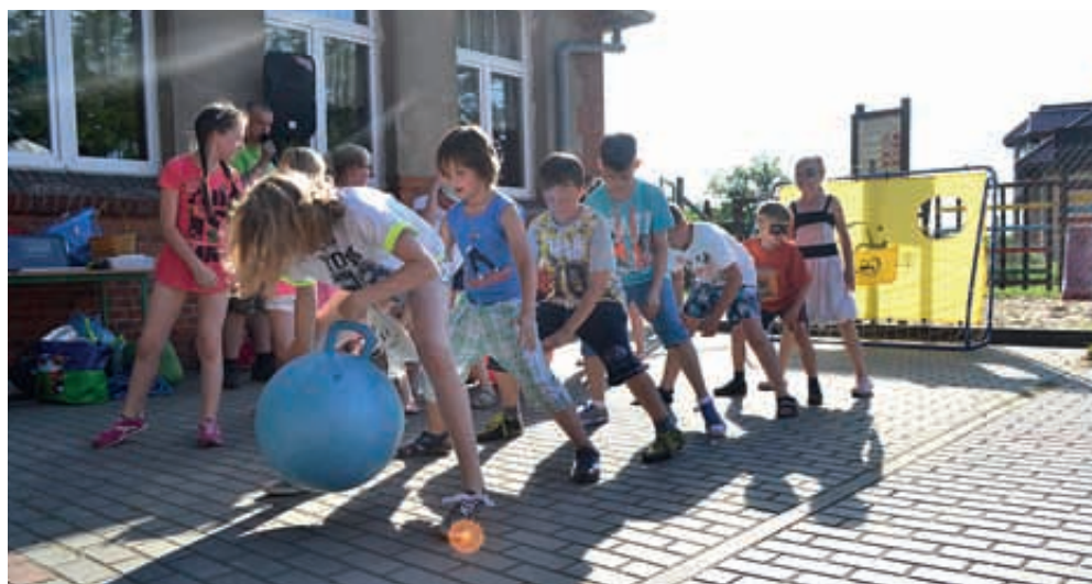
Nowa Wieś. Dzień Dziecka