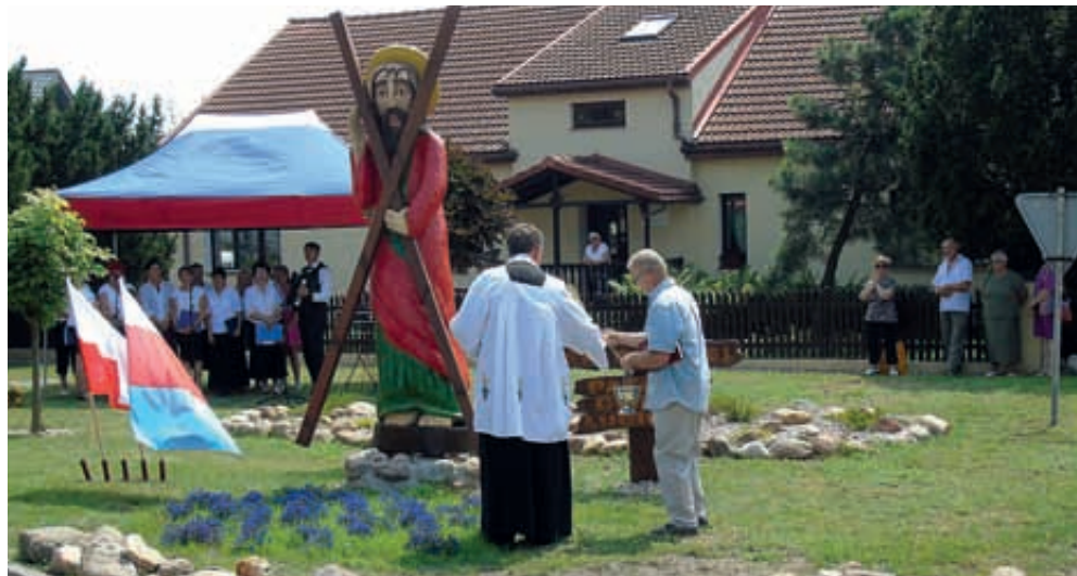
Lubicz Dolny. Poświęcenie figury św. Andrzeja - patrona gminy