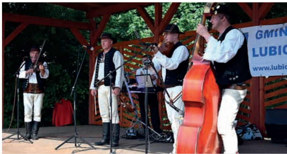
Lubicz Dolny. Występ góralskiej kapeli Ochodzita