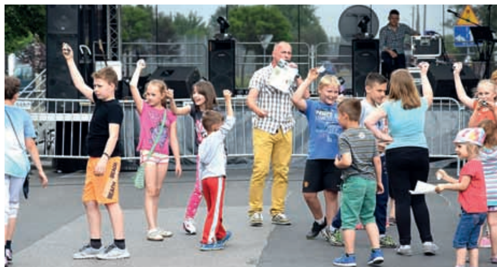
Lubicz Górny. Święto ulicy Lipnowskiej