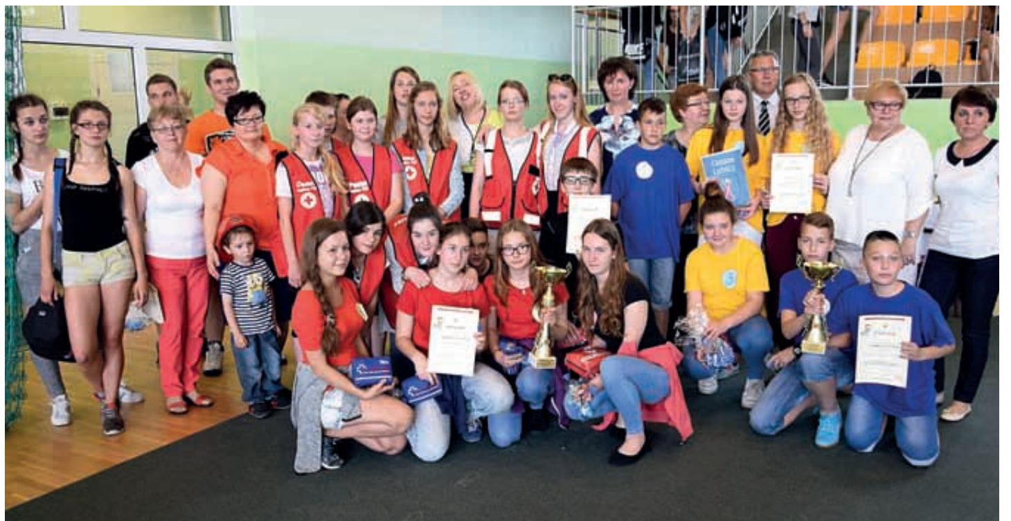
W Szkolnych Mistrzostwach Pierwszej Pomocy wzięło udział osiem drużyn, w tym cztery z naszej gminy