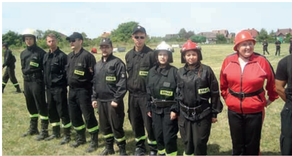
Rogówko. Gminne zawody sportowo-pożarnicze