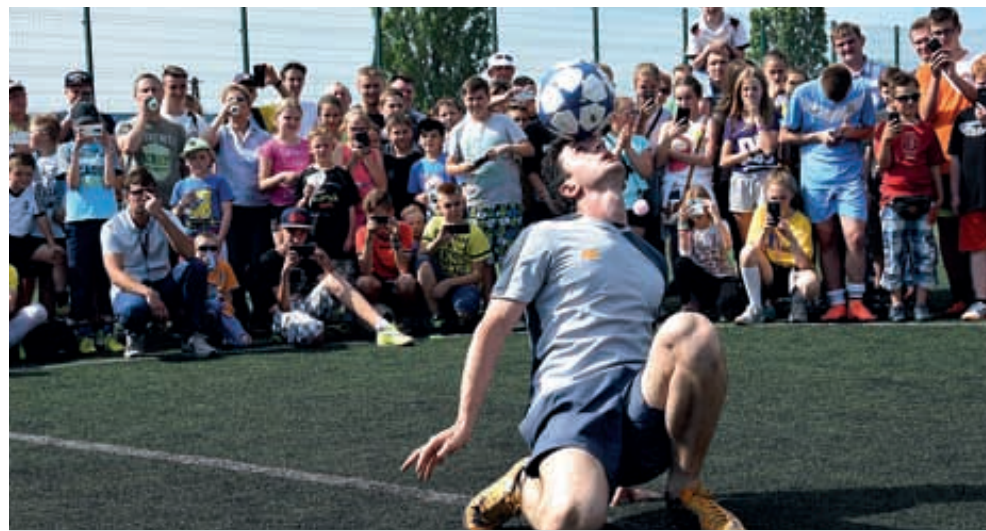
Lubicz Górny. Liga Orlika i Gminny Dzień Dziecka