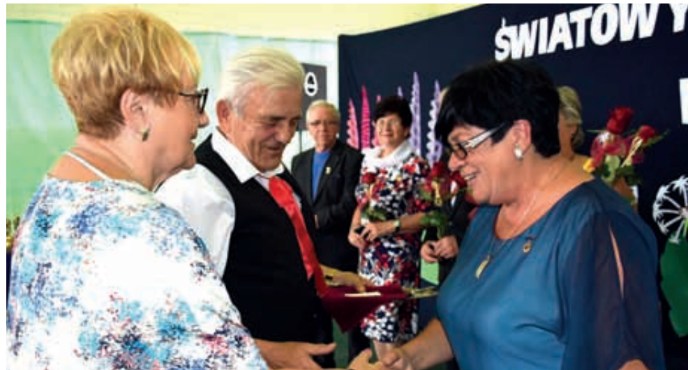
Grębocin. Światowy Dzień Inwalidy