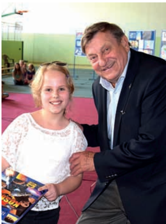
W Grębocinie Mirosław Hermaszewski wręczył nagrody uczniom, którzy zostali docenieni w konkursach zorganizowanych z okazji jego wizyty