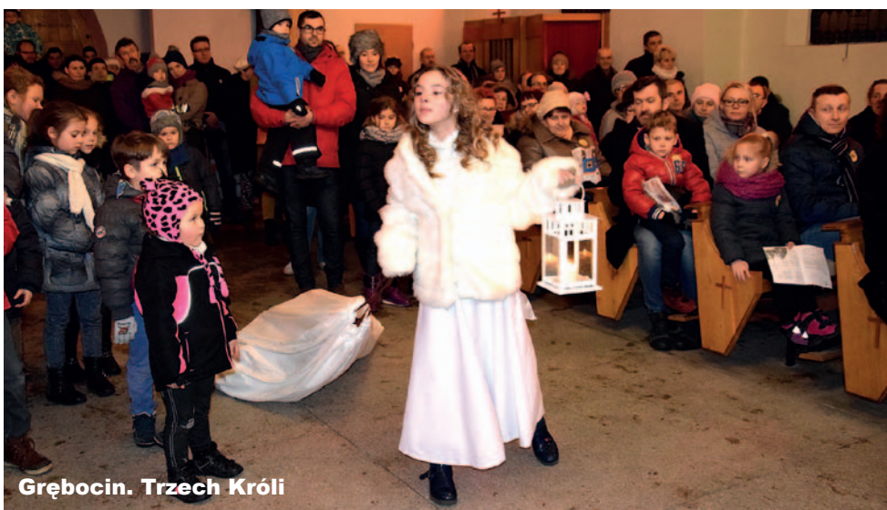
Grębocin. Trzech Króli