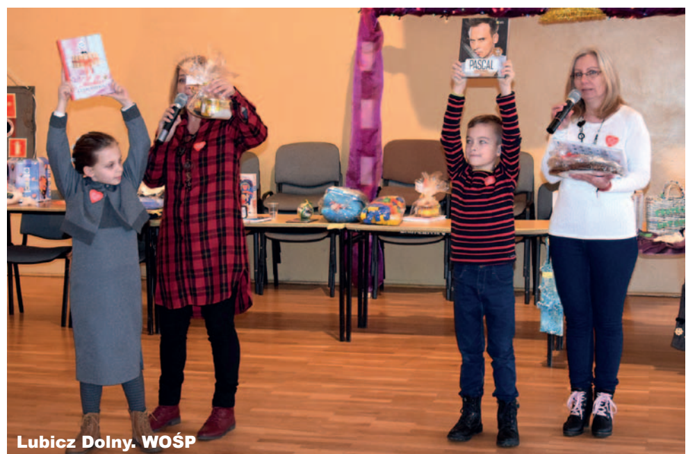
Lubicz Dolny. WOŚP