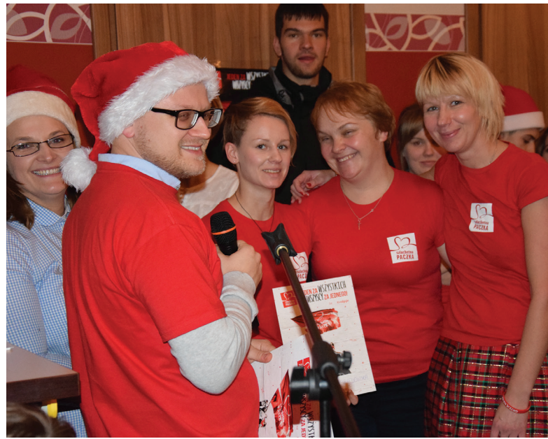
Wśród wolontariuszy byli także mieszkańcy naszej gminy