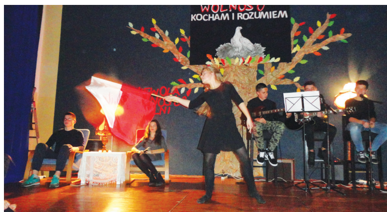
W Grębocinie młodzież wystawiła przedstawienie na podstawie dramatu Różewicza

W Gronowie uczniowie klas IV-VI Szkoły Podstawowej zaproponowali inscenizację, której