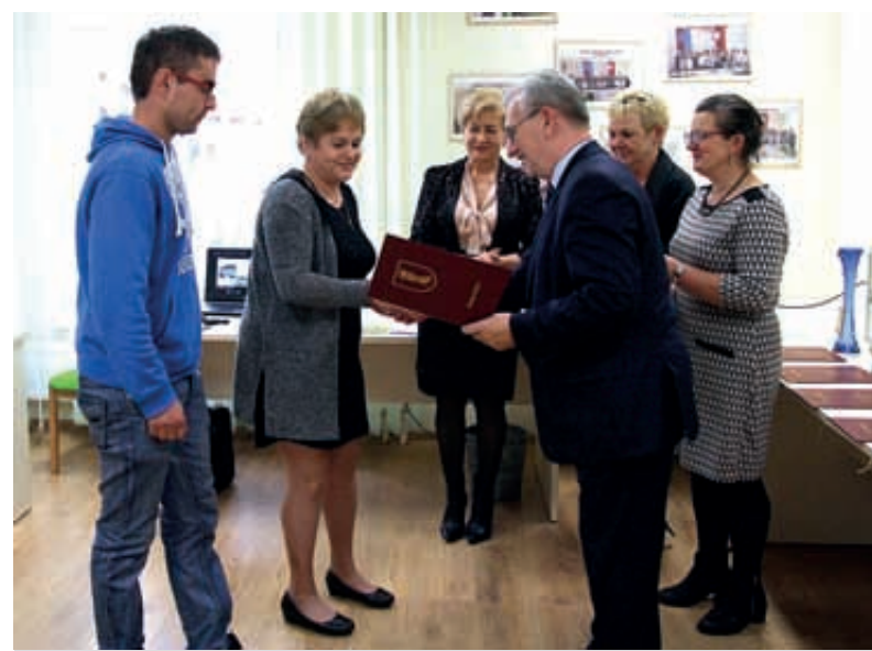
Laureaci konkursu otrzymali dyplomy gratulacyjne i nagrody rzeczowe