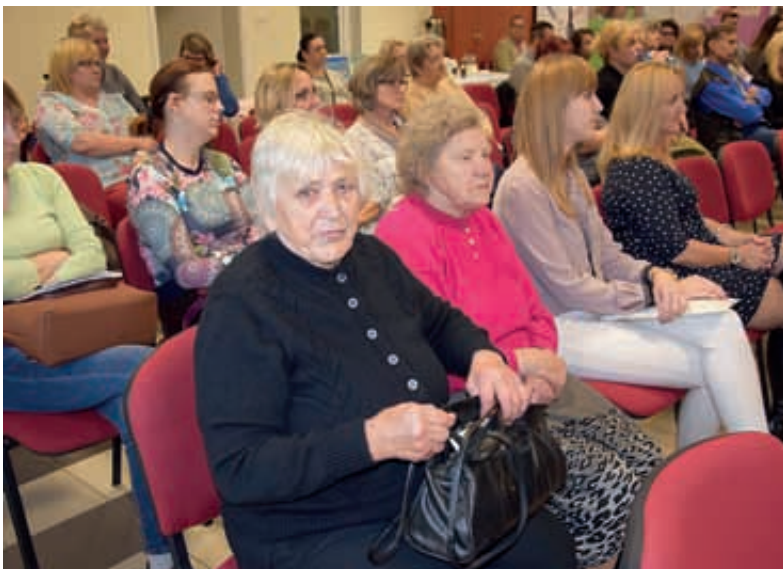
- To było bardzo pouczające spotkanie – komentowali uczestnicy konferencji