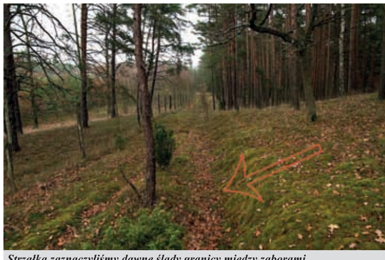
Strzałką zaznaczyliśmy dawne ślady granicy między zaborami