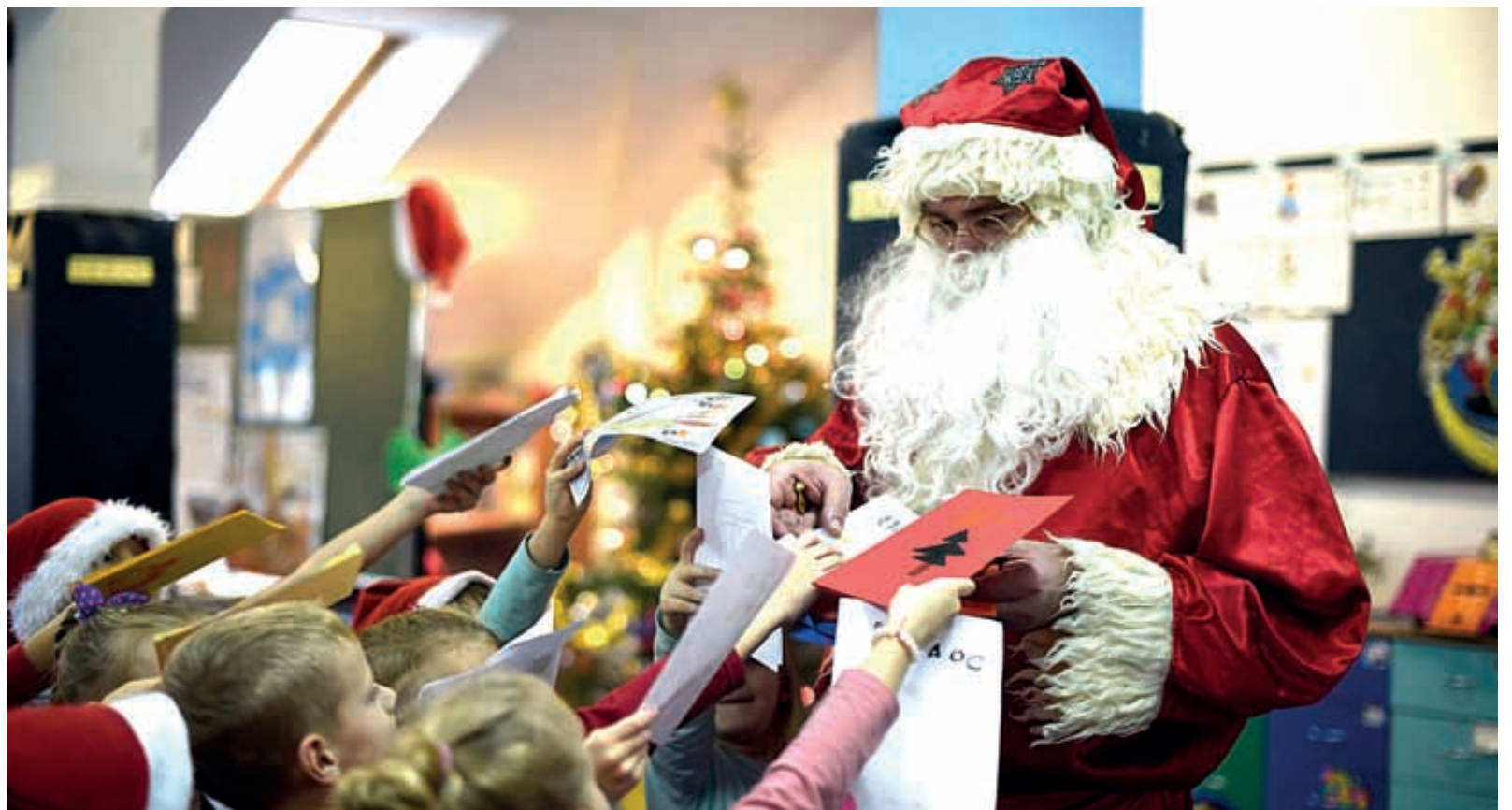
Mikolaj, jak co roku 6 grudnia, odwiedził uczniów szkoły w Grębocinie. Dzieci skorzystały z okazji, aby przekazać mu listy z zamówieniami na prezenty pod choinkę. Pojawił się także w wielu innych miejscach w naszej gminie m.in. w Grabowcu, Kopaninie, Krobi, Lubiczu Dolnym i Górnym, Młyńcu Pierwszym i Drugim, Nowej Wsi czy Złotorii, obdarowując dzieci, a czasami też dorosłych, słodkościami.