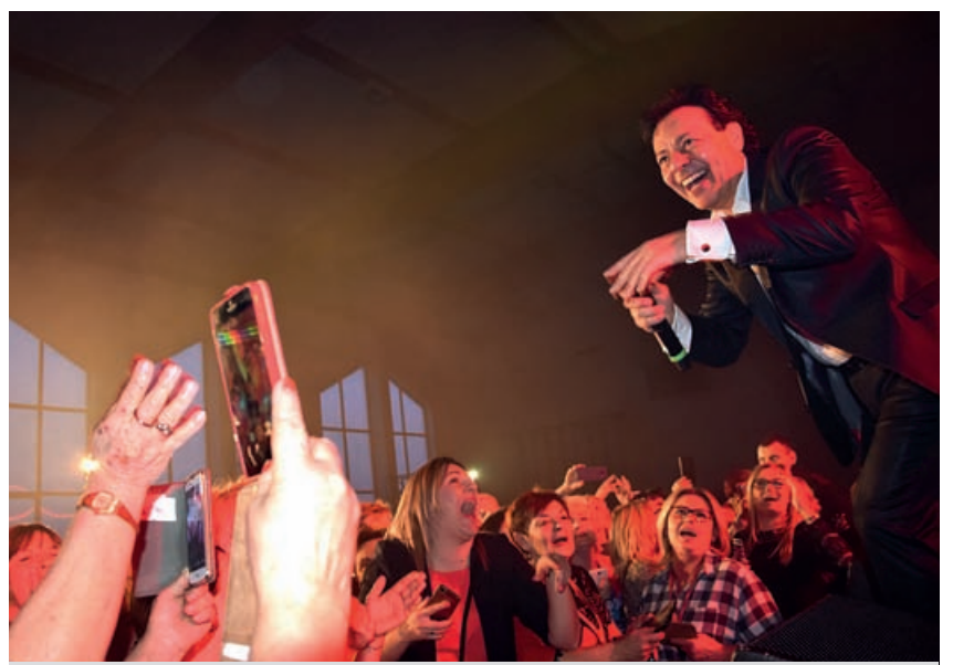
Panie były zachwycone występem tegorocznej gwiazdy. Kilkakrotnie prosiły artystę o bis