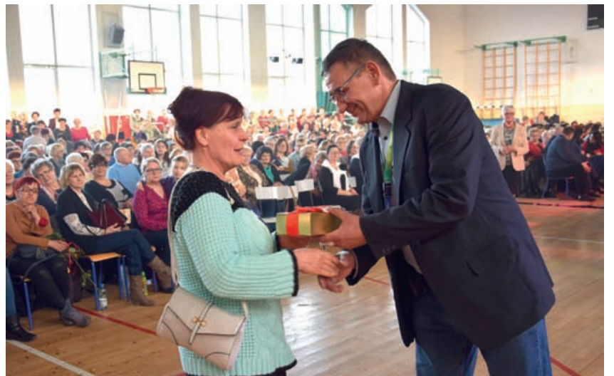
Jak zwykle nie zabrakło także konkursu z dziesiątkami nagród