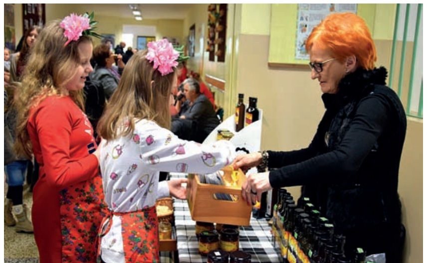
Dla pań przygotowano wiele stoisk z rękodziełem, biżuterią, zdrową żywnością, obrazami, biblioteki publicznej, dietetyka, kosmetyczki, radcy prawnego i innych