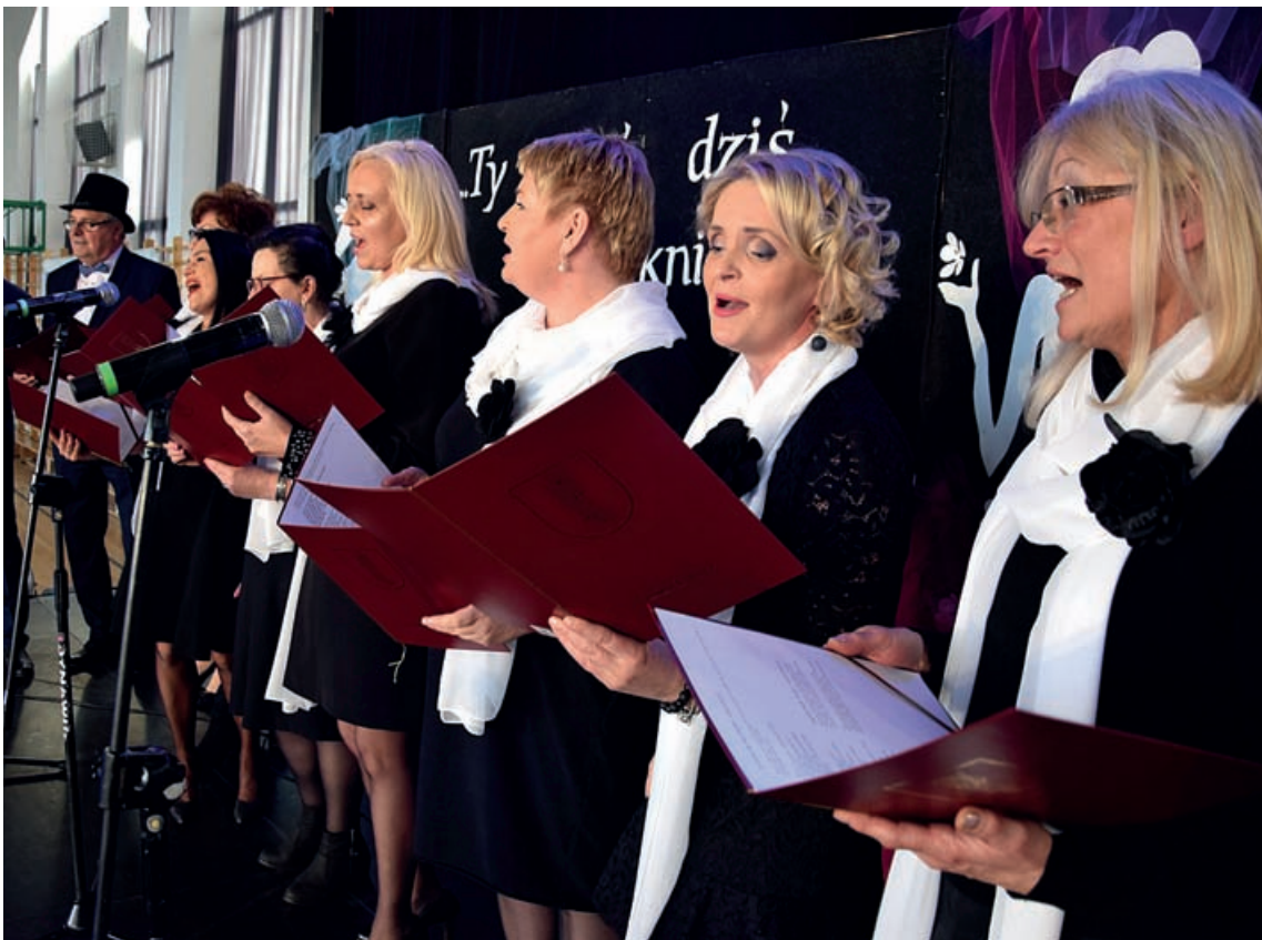
W tym roku niespodzianką był występ grupy Alebabki i przyjaciele, składającej się z radnych i dyrektorek szkół