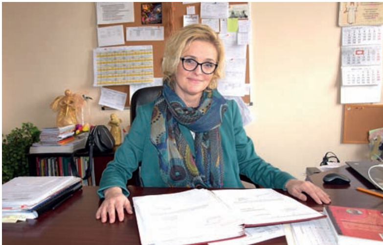
Fot. Autorka Joanna Ardanowska: - Uczniowie, którzy wyjeżdżają wybierani są na zasadzie konkursu

- Mamy w szkole doradcę zawodowego, ale ci uczniowie wykonują dodatkową pracę. Praktyczną, i to poprzez zabawę. Oprócz projektowego zadania, muszą wykonać także prezentację naszego kraju oraz przygotować się do