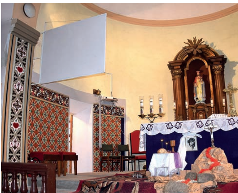
Odkryte polichromie są charakterystyczne dla ornamentyki kościołów wyznania ewangelickiego