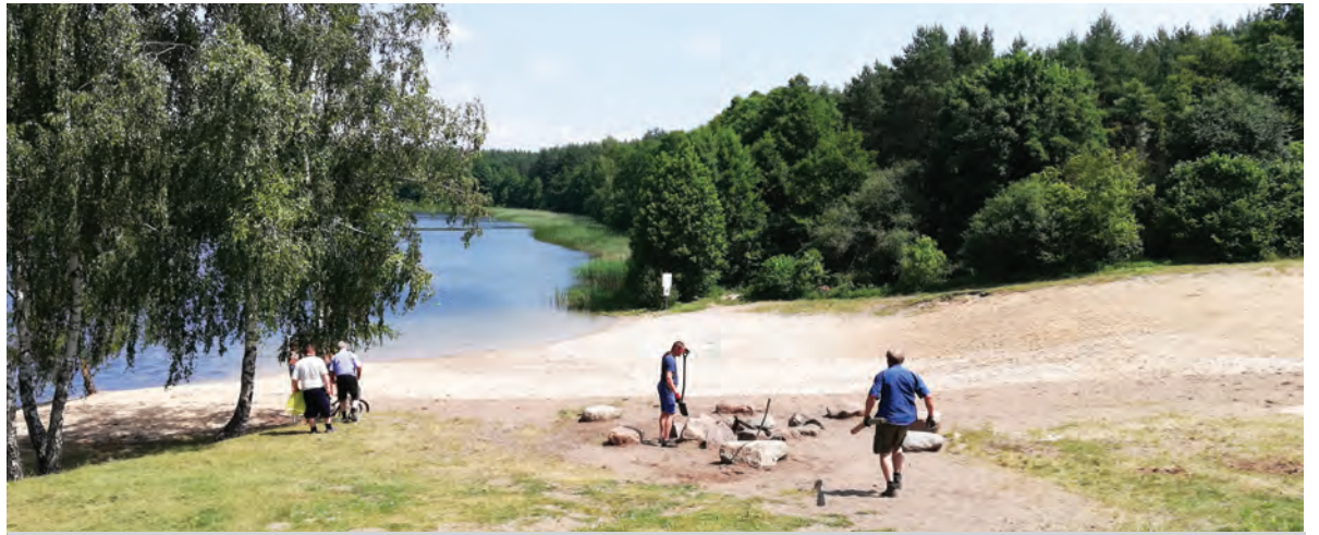
Ostatnie przygotowania przed otwarciem „kapieliska”

Nad jeziorem będzie funkcjonował bar z ogródkiem gastronomicznym, mini