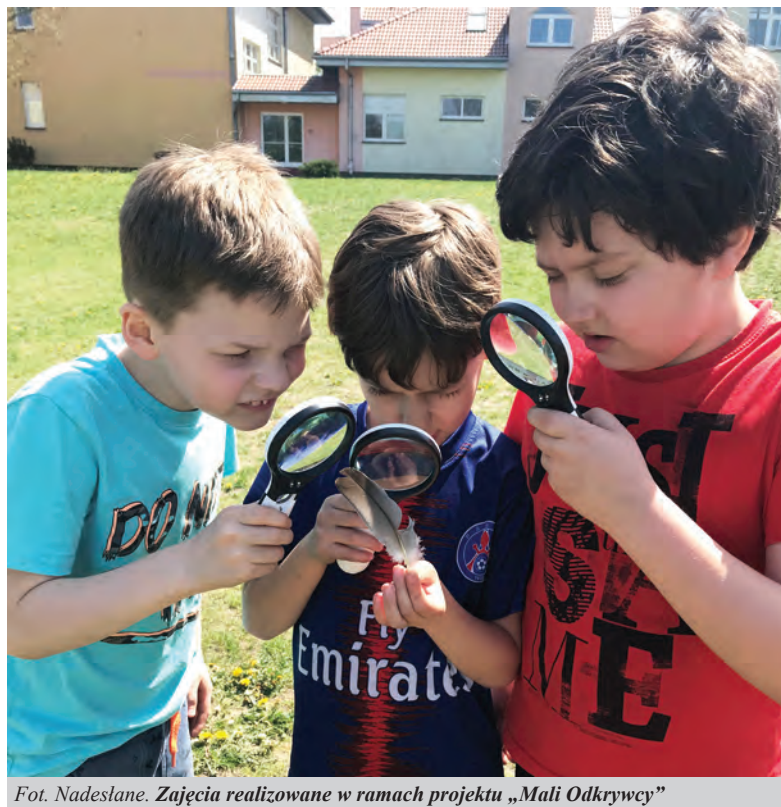
Zajęcia realizowane w ramach projektu „Mali Odkrywczy”