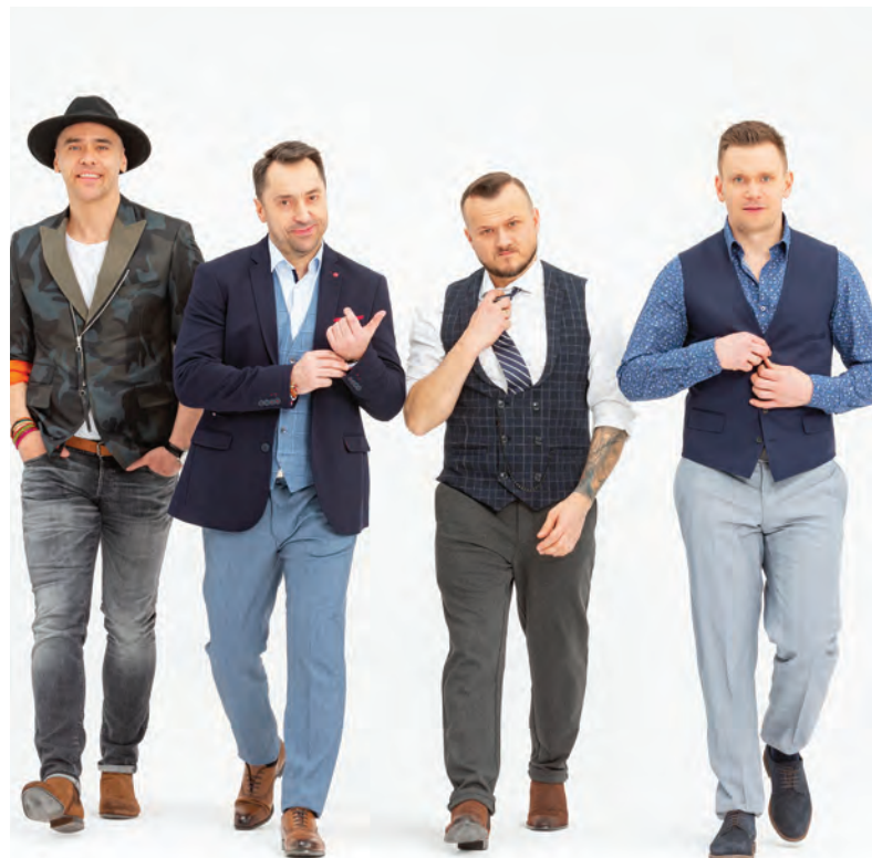
Zespół Boys cieszy się popularnością od wielu lat

Subiektywne podsumowanie Marka Nicewicza, wójta gminy Lubicz