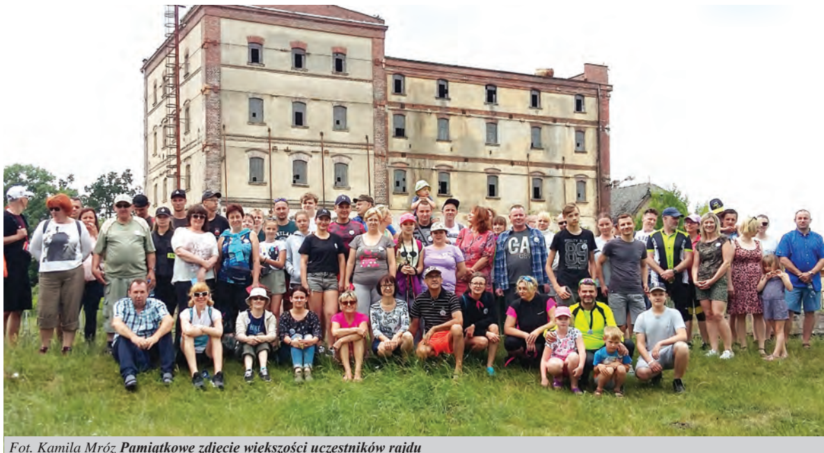
Pamiątkowe zdjęcie większości uczestników rajdu